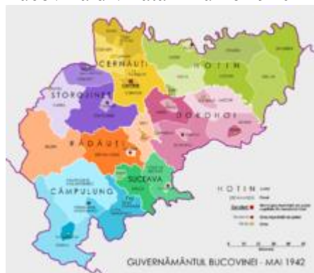
Harta administrativă a Guvernământului Bucovinei în mai 1942.

După prăbușirea monarhiei austro-ungare respectiv dezmembrarea imperiului în state naționale, Consiliul Național al Bucovinei (C.N.B.), întrunit la 28 noiembrie 1918 , a hotărât în majoritate Unirea cu România . Voturile majoritare au venit din partea românilor, germanilor, evreilor și polonezilor, iar cele împotriva doar din partea minorității ucrainene. Ca urmare a hotărârii „C.N.B.”, trupele române au intrat în teritoriu, sub comanda generalului Iacob Zadik , consfințind actul și zădărniciind manevrele militare ale Republicii Populare a Ucrainei Occidentale . Unirea Bucovinei cu România este recunoscută oficial, în 1919 , prin tratatul de pace de la Saint Germain încheiat cu Austria la data de 10 septembrie 1919.